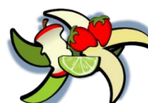
non abbandonare rifiuti