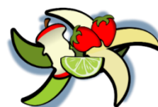
non abbandonare rifiuti