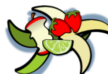
non abbandonare rifiuti